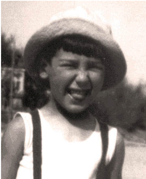
UN MASCHERONE LACRIMOSO

Il nonno era tutto orgoglioso del nipote e mi portava spesso in giro con lui, anche nella pineta che si stendeva nell'interno, verso la ferrovia.